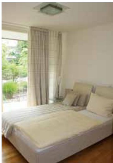
Schlafzimmer im Gästeappartement

Statt im Hotel zu wohnen, starteten mein Mann und ich die Probe aufs Exempel. Als gebürtige Bremerin hatte ich noch gute Freundinnen hier und eine hatte mir einen Prospekt der Residenz zugeschickt. Was wir lasen und sahen, überzeugte mich und meinen Mann so, dass wir sofort in der Residenz anriefen, um ein Probewohnen zu vereinbaren. Beflügelt von der Neugier, wurden wir mit offenen Armen empfangen. Nach einem ungezwungenen und freundlichen Kennenlernen und einem spannenden Erkundungsrundgang durch das Haus starteten wir unser Experiment „Probewohnen“ in einer behaglich eingerichteten Wohnung. Nach dem Wochenende stand das Urteil fest: Test bestanden – wir kommen!