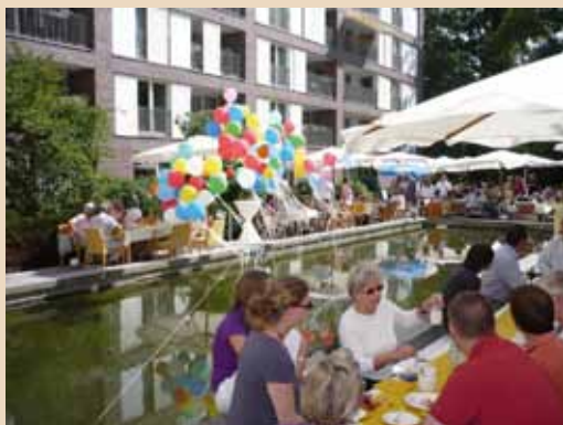
Das jährliche Sommerfest

Im Laufe des Jahres gibt es viele Anlässe, um in der DKV-Residenz gemeinsam zu feiern. Das Sommerfest im August und die Weihnachtsfeier am vierten Advent gehören schon zur Tradition. Für das Sommerfest wird der gesamte Innenhof genutzt. An den aufgestellten Tischen können die Bewohner zusammen sitzen und gemeinsam Gegrilltes und frisch gebackenen Kuchen genießen. In den vergangenen zwei Jahren haben sich einige Besucher ein Stück Sommererinnerung mit nach Hause genommen, es handelte sich um selbst zusammengestellte Blumensträuße und Blumenkränze.